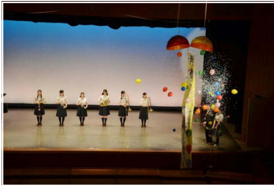
<オープニングセレモニー>