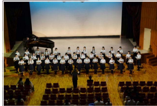
<舞台発表のトップを飾る合唱部>