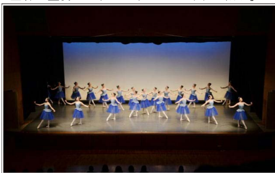
<2年バレエコースの発表>