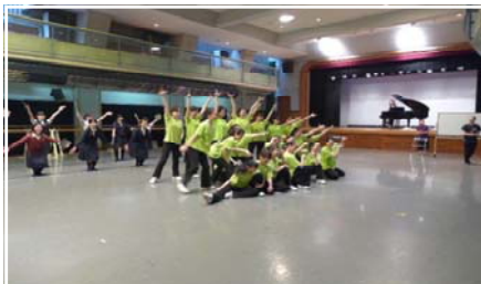
＜楽苑ホールでのリハーサル風景＞